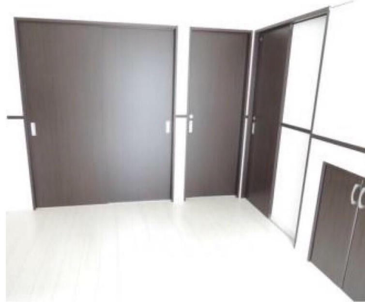
DKから洋室側を見たところ (左の扉が洋室の扉)